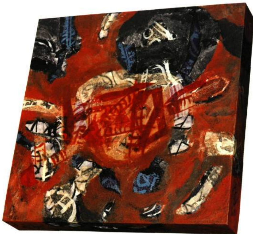
Fervéo , 2001 Techniques mixtes sur toile 50 x 50 x 8 cm