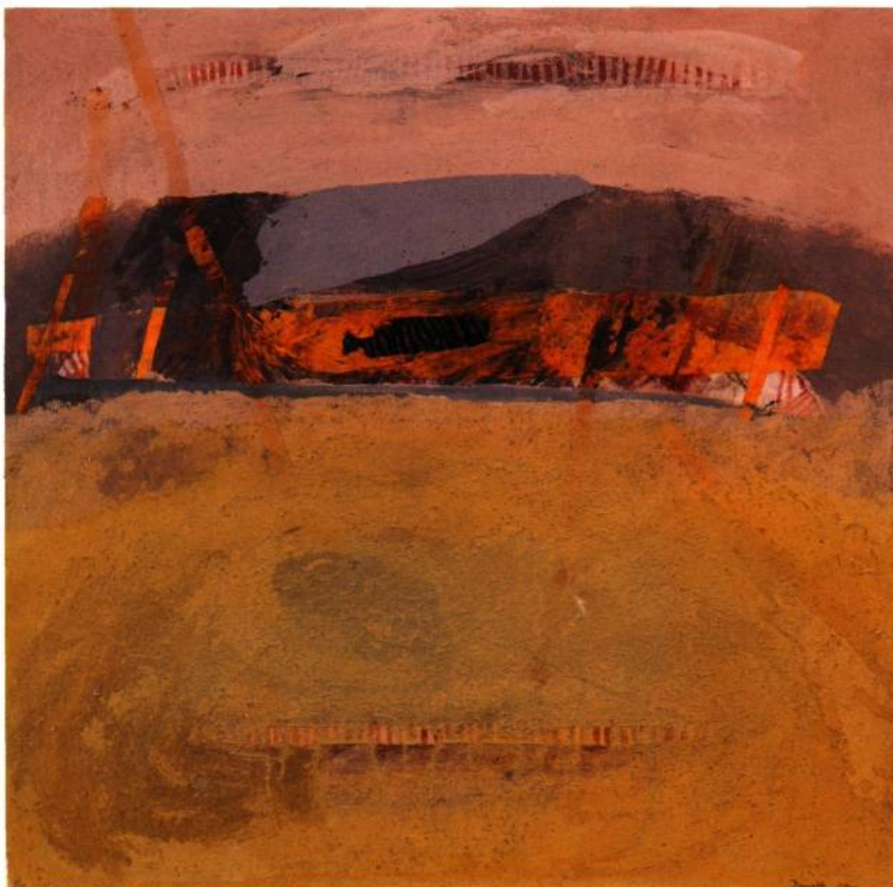
Lex, 2001 Techniques mixtes sur toile 50 x 50 x 8 cm

L ES LIEUX QUE PEINT JEAN DOMETTI PARAISSENT PRESQUE TOUS EMPREINTS D'UN AIR FAMILIER. ILS SEMBLent POURTANT IMPOSSIBLES À IDENTIFIER !