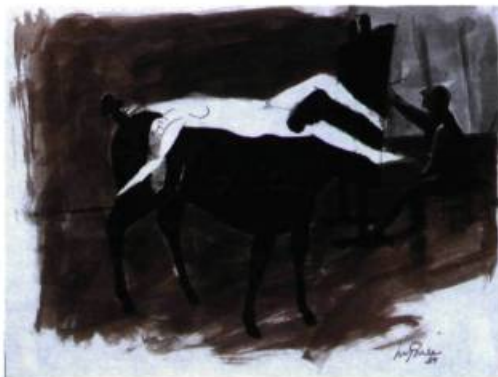
Painter and model 1989 Aquarelle et encre 21 x 27 cm