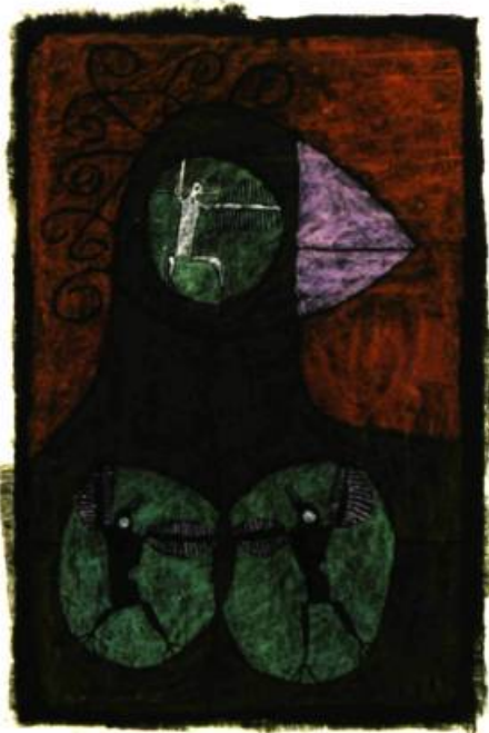
Sans titre, 1967 Pastel et encres sur papier 66 x 51 cm Collection particulière

Référence : Gérard Tremblay—L'invention d'un monde , Vie des Arts, automne 2003, no 192, p. 69-71.