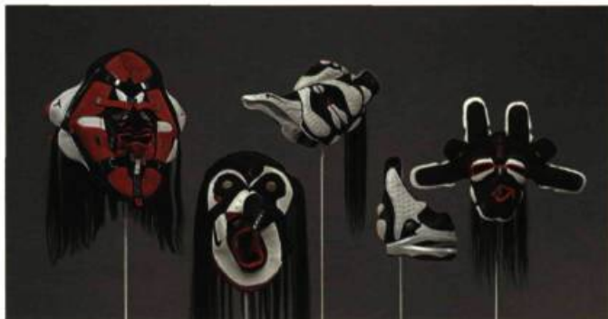
Vue de l'installation Prototypes (1998-2005)