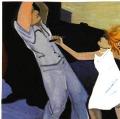
A recurring image: I often thought of killing him.

La lumière est un autre aspect important des tableaux de Scott. Le regard du peintre n'embrasse pas seulement les formes et les volumes, n'estime pas seulement les distances dans l'espace, n'apprécie pas seulement les couleurs, les accords, les contrastes, les valeurs: son œil pèse et soupèse aussi, avec l'esprit-vue, qui