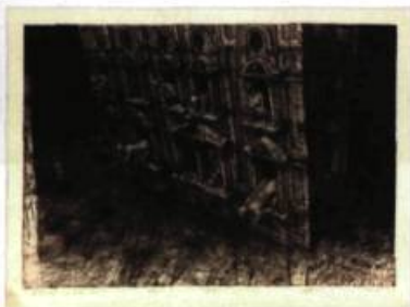
Marcin Bialas (Pologne) On the roof of a block VI, 2006 Intaglio 70 x 100 cm