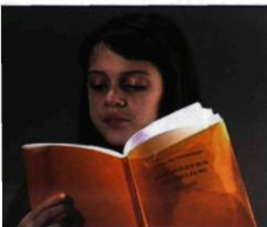
Exposition De l'écriture Gary Hill Vidéo