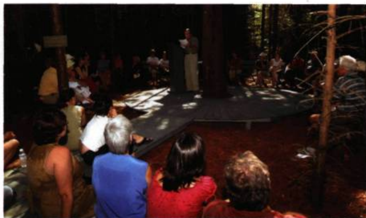
Spectacle de poésie Jardins du Précambrien