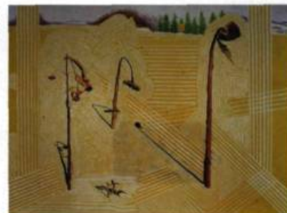
G. Peter Jemison Sentinelles, 2006 Acrylique et collage sur toile

La Galerie d'art d'Ottawa La Cour des arts 2, avenue Daly Ottawa Tél. : 613 233-8699 www.ottawaartgallery.ca Du 21 juin au 2 septembre 2007