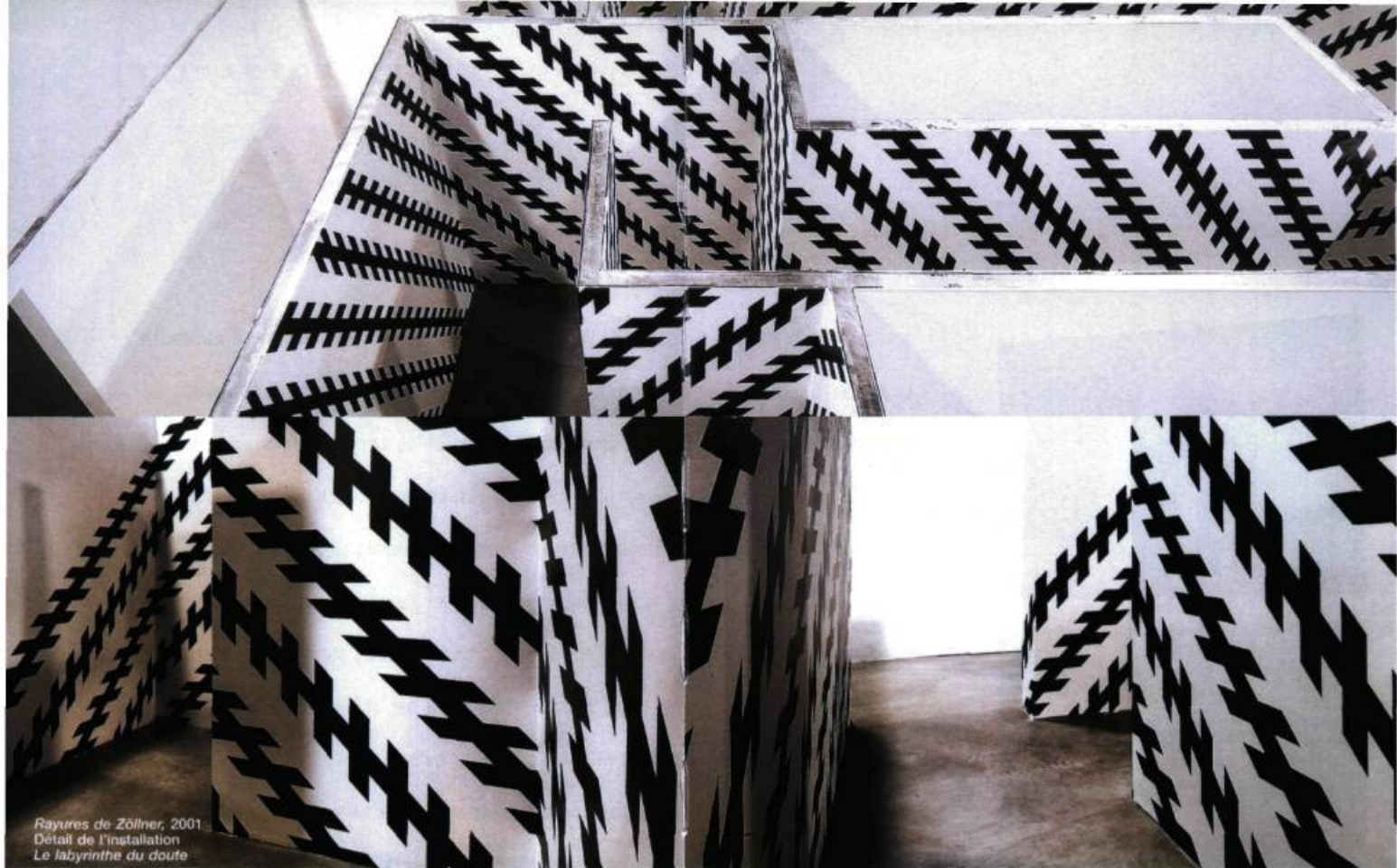
Rayures de Zöllner, 2001 Détail de l'installation Le labyrinthe du doute

d'une volière à l'autre. Vous savez peut-être que la Belgique, moitié wallonne, moitié flamande, a un problème. Le problème du Problème belge doit être plus facile à régler que celui avec lequel est aux prises ce petit pays bilingue. Vous voyez donc probablement des sansonnets perchés sur les jeunes bouleaux qui constituent un contrepoint visuel aux arbres verdoyants que le vent agite derrière les fenêtres.