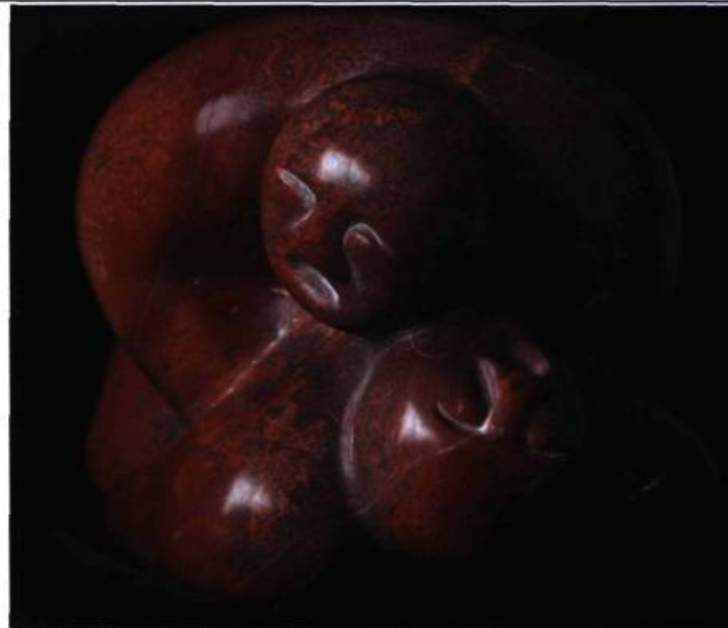
Écoute , 2006 Sculpture Pierre du nord de l'Inde 40 x 25 x 26 cm

D'autres thèmes, tels l'ange ou l'appel de l'enfant à l'invisible protection, sont exécutés dans le même langage sculptural que celui des couples. Cependant, l'artiste semble s'écarter quelque peu de