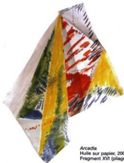
Arcadia Huile sur papier, 2006 Fragment XVI (pliage)

Le corps, c'est celui du modèle. Tenu pour la référence la plus fondamentale de la peinture jusqu'à l'abstraction, il est montré par Petry, Rondelli, Allen que, même réduit à n'être plus que « l'ombre de sa figure » ( Shadow Figure ), c'est encore lui qui dédimensionne la toile pour l'animer. Démonstration poursuivie par Running... où est ajouté le mouvement; dispositif mis en valeur par l'inversion des plans, coloré pour le fond, noir et blanc pour les corps en mouvement. Quant à l'identité du peintre, celle de Nancy Petry questionne trois éléments. Premier élément: l'histoire, avec sa ville natale Montréal, où elle trace un auto-portrait éphémère, sur la neige... Pour les deux autres éléments, elle utilise l'antinomie de l'eau (la neige) et du feu, en brûlant une