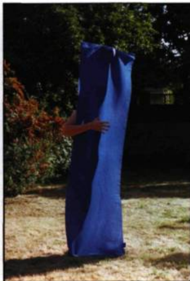
The Shadow Figures, 1978