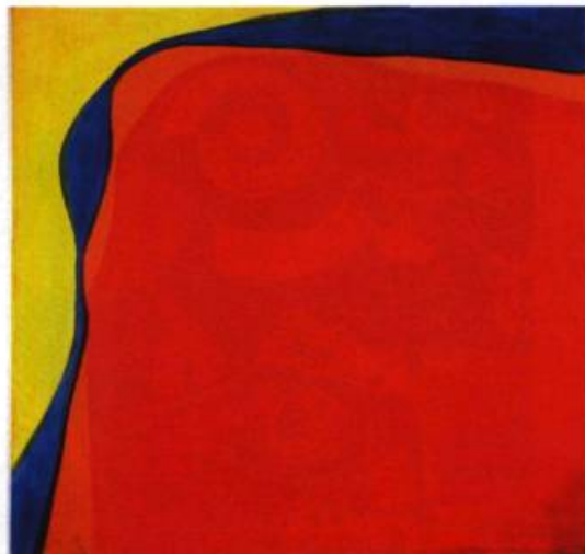
Sitkat (Série Rivers) Acrylique et huile sur toile, 1972 104 x 104 cm

Le corps, c'est celui du modèle. Tenu pour la référence la plus fondamentale de la peinture jusqu'à l'abstraction, il est montré par Petry, Rondelli, Allen que, même réduit à n'être plus que « l'ombre de sa figure » ( Shadow Figure ), c'est encore lui qui dédimensionne la toile pour l'animer. Démonstration poursuivie par Running... où est ajouté le mouvement; dispositif mis en valeur par l'inversion des plans, coloré pour le fond, noir et blanc pour les corps en mouvement. Quant à l'identité du peintre, celle de Nancy Petry questionne trois éléments. Premier élément: l'histoire, avec sa ville natale Montréal, où elle trace un auto-portrait éphémère, sur la neige... Pour les deux autres éléments, elle utilise l'antinomie de l'eau (la neige) et du feu, en brûlant une