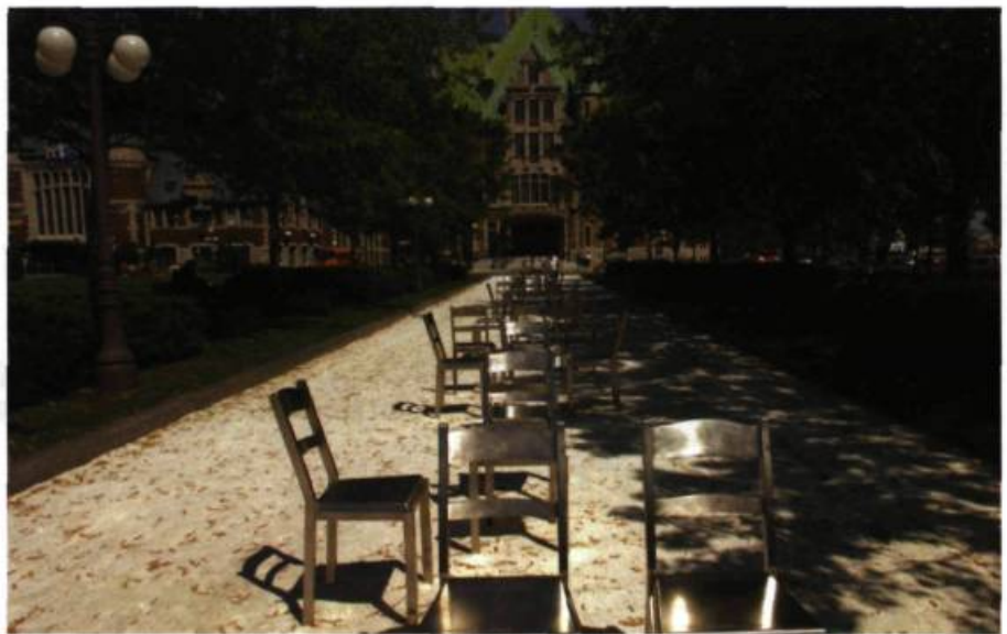
Rêver le Nouveau Monde, 2008 Gare du Palais de Québec Installation-sculpture 40 chaises Acier inoxydable

année et dans le même lieu, il participe à l'exposition collective Tampons d'artistes, d'écrivaines et d'écrivains réunissant des gens de lettres et des artistes en arts visuels. Il a aussi collaboré à plusieurs reprises avec des poètes notamment avec Denise Desautels qui publie en 1990 un livre de prose poétique à partir de trois œuvres de l'artiste qui avaient été exposées lors de sa participation à la Biennale de Venise en 1988. Michel Goulet lui a réservé un extrait d'un poème, tiré de L'œil au ralenti (Éditions du Noroit, 2007), qui illustre très bien le sens qu'il veut donner à l'installation;