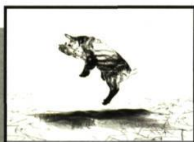
Michel Boulanger Champ témoin (détail), 2008. Film d'animation 3D numérique, 2 mn en boucle

et en collaboration avec la Biennale internationale d'estampe contemporaine, Emballer le banal a comme objectif de redéfinir le patrimoine québécois dans un contexte contemporain. En effet, l'utilisation de la courtepointe (symbole traditionnel québécois) par les artistes, qu'il soient locaux ou étrangers, permet de revisiter le folklore de façon moderne et de l'insérer dans un contexte actuel. Les œuvres réalisées en tissu recyclés serviront à emballer des objets du centre-ville (bancs de parc ou boîtes aux lettres!) et à créer un véritable happening avec le public! Un événement qui ne semble pas banal du tout!