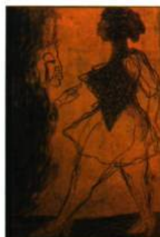
Martin Garcia Rivera, Puerto Rico La promesa: laberinto , 2008 Gravure sur bois 110 x 76 cm Prix Invitation Presse Papier dans le cadre de la Biennale Internationale d'estampe contemporaine de Trois-Rivières