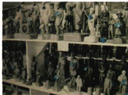
Ji-Sun Shin Les colliers verts , 2008

Véritable hymne à la carte postale et soulignant le centenaire de la Traverse Rivière-du-Loup/Saint-Siméon, Rivière-du-Loup à la carte - Le Volet maritime présentera dans le hall d'entrée du Musée, des cartes postales à la vocation maritime en grand format. Photographie et art postal, un duo vecteur de transmission d'une réalité historique ou simple image d'Épinal? À vous de le découvrir! GZ et MPB