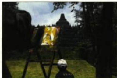
Sela paints by the temple, 2008