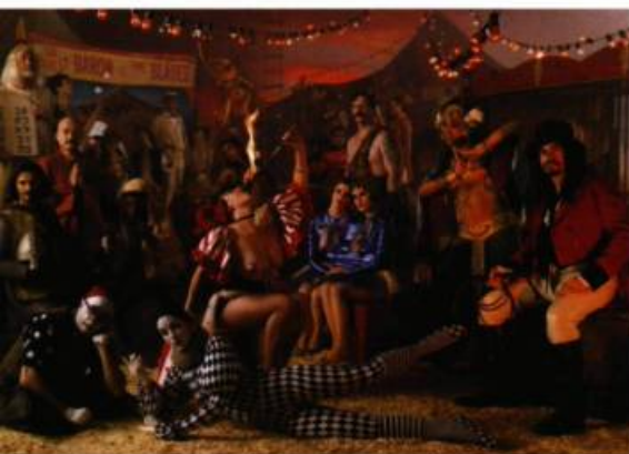
© Wayne Schoenfeld Circus of Life/illustration série #35, 2006 Photographie

La galerie [sas] présente ICônes/Iconoclastes , une série sur le cirque nord-américain imaginée par le photographe américain Wayne Schoenfeld. La galerie a réuni une quinzaine d'œuvres présentées en février dernier lors de la Nuit blanche de Montréal. Les œuvres de Schoenfeld se présentent comme de véritables tableaux vivants, inspirés par le cirque nord-américain des années 1930. Il s'en dégage une ambiance ludique et cahotique à la fois. On découvre deux séries de photographies : Cirque d'autrefois et Cirque de la vie . Clowns mélancoliques, dompteuses d'animaux, amazones acrobates, nains, sœurs siamoises et cracheuses de feu cohabitent en des lieux forains qui ont marqué l'imaginaire collectif de l'Occident. L'ensemble des profits provenant de la vente des œuvres de Wayne Schoenfeld sera réinvesti dans divers projets sociaux d'Exeko. MGB