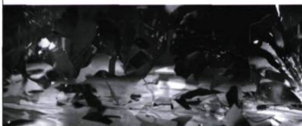
© Gwenaël Bélanger, Le Faux mouvement (7' - 120"), 1/6, 2008, impression jet d'encre, 101,6 x 274 cm.