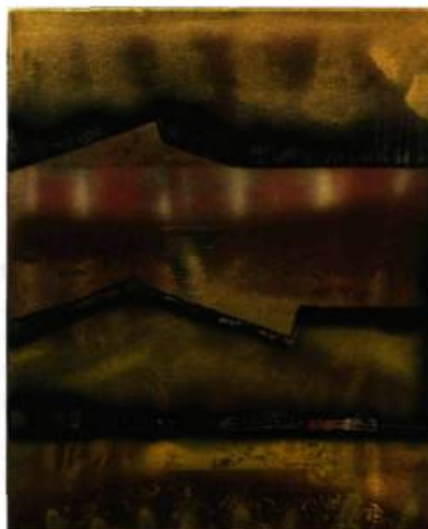
Annick Gauvreau Tornades au Nevada , 2008 Acrylique sur toile 51 x 40,5 cm