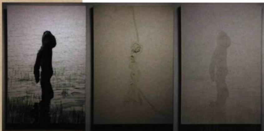
Hélène Brunet-Neumann Passage 1 , 2009 Photographie Acrylique et collage de fils sur toile, projection Triptyque de 162,56 x 91,44 cm

Comme le dit Anithe de Carvalho, la commissaire de l'exposition: « Depuis plus d'un siècle, il semble que l'être humain soit peu soucieux de l'avenir de sa planète. Développements de la production, avancements scientifiques, innovations technologiques de toutes sortes transforment l'environnement et réduisent de manière exponentielle la nature à un espace hostile. » Entre gestes artistiques subtils et œuvres sociales plus directes, quelle sera leur vision? MGB