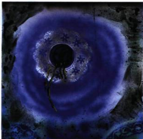
Pierre Gauvreau Les larmes de la nuit , 2008 Techniques mixtes sur toile 61 x 61 cm © Pierre Gauvreau/Sodrac 2009