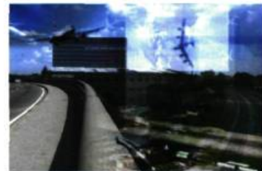
Transmutations (écotopie 4) , 2008 Vidéo numérique, 4 min 18 s, projection sur 3 moniteurs Réalisation : Martin Bourgault, avec la collaboration d'Irena Latek - montage : Martin Bourgault - caméra : Martin Bourgault, Fannie Duguay-Lefebvre, Alan Knight, Elise Lacoursière Bourget, Irena Latek, Anouck Lemarquis, Michel Lefebvre - recherche : Martin Bourgault

Fruit d'une collaboration entre medialabAU et le laboratoire Vision3D, le projet réunit des architectes, des artistes, des chercheurs scientifiques intéressés par les nouvelles formes de culture urbaine et la représentation architecturale par les nouveaux médias. Des projets collectifs antérieurs ont été présentés par medialabAU : Espaces mouvants Soft Public Spaces en 2003 à la SAT et Ubiquités publiques Desinchronized Public Spaces à la SAT en 2006. Le projet intègre aussi des expérimentations sonores produites par Lighttwist. MGB