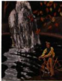
1- Mimi Côté Madame Baltic , 2002 Aquarelle 25 x 20 cm