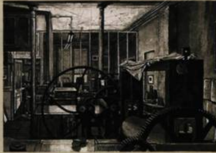
Atelier René Tazé VII (détail), 2008 Eau forte, aquatine et roulette 44,5 X 82 cm

Tél. : 514 276 34 94 alainpiroir@bellnet.ca www.ateliergaleriealainpiroir.com