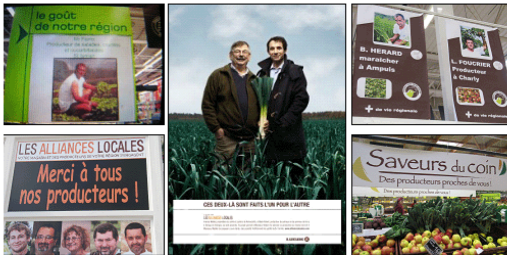
Figure 3. L'utilisation de la symbolique territoriale dans la grande distribution