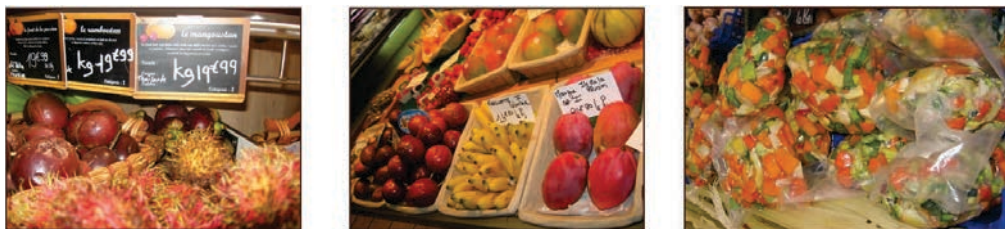
Figure 1. L'alimentation moderne, entre extra-temporalité et extra-spatialité