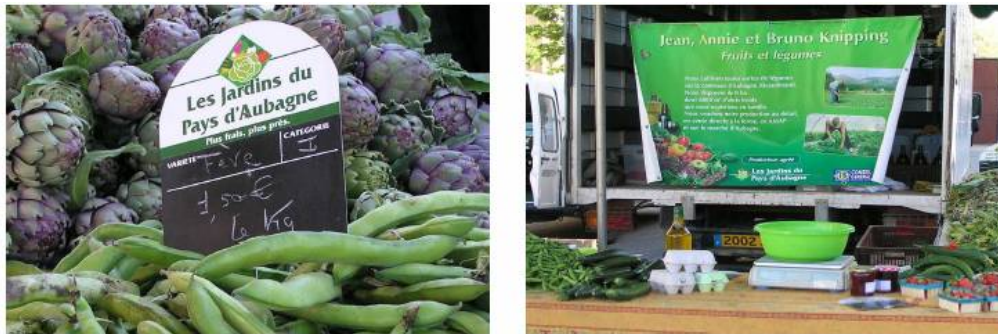
Figure 5. La marque collective Les jardins d'Aubagne, symbole de la volonté collective de maintenir l'agriculture péri-urbaine en Pays d'Aubagne

périurbaines. La ville d'Aubagne a initié une politique agricole périurbaine élargie depuis à la communauté d'agglomération (Figure 5).