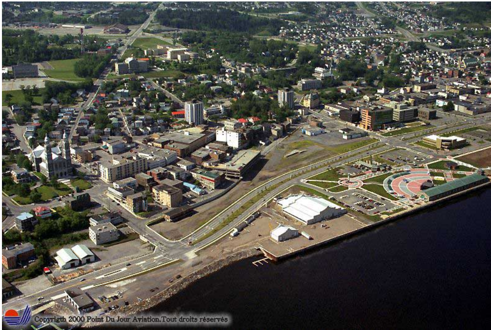
Figure 1. Le site de la zone portuaire de Chicoutimi