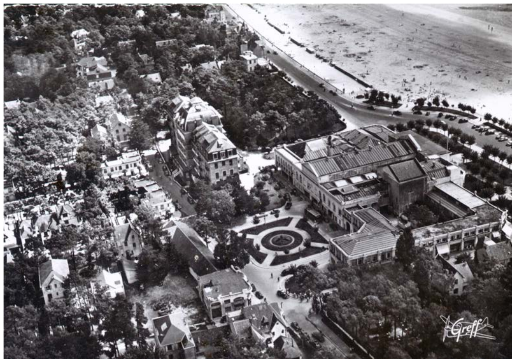
Figure 3. Carte postale de La Baule-Escoublac : Les abords du casino dans les années 1950.