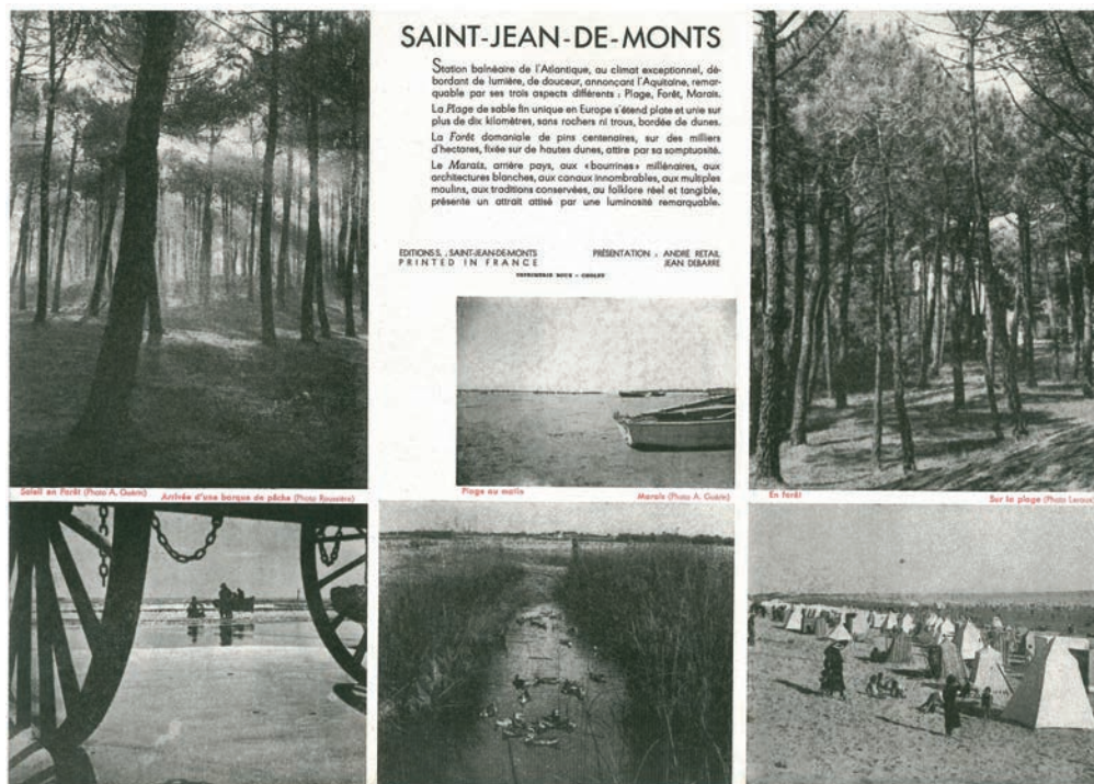
Figure 4. Dépliant touristique de Saint-Jean-de-Monts, à la fin des années 1940.