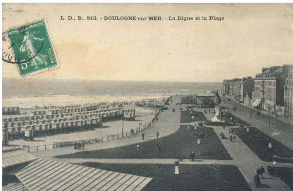
Figure 1. Carte postale « Boulogne-sur-Mer, la digue et la plage », années 1910.