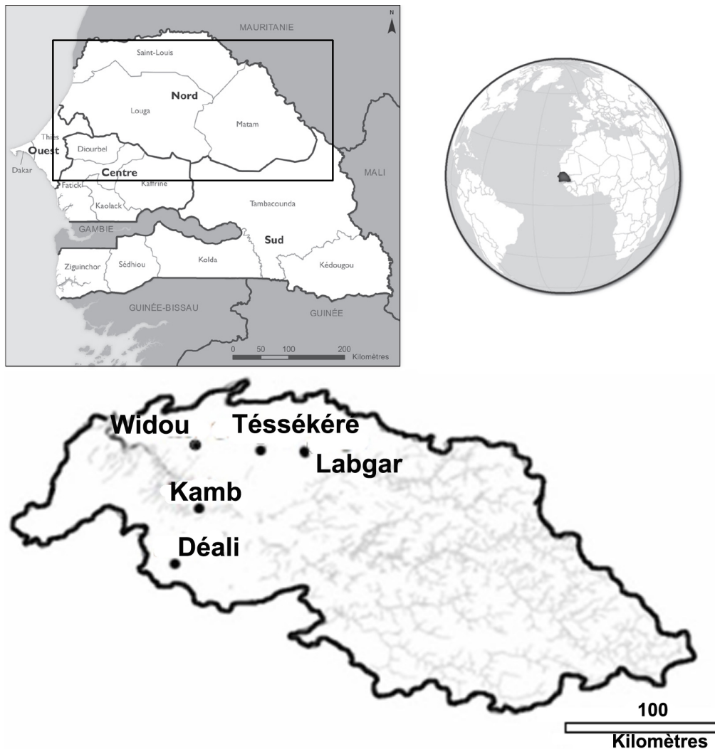
Figure 2. Localisation des sites d'étude / Location of study sites.