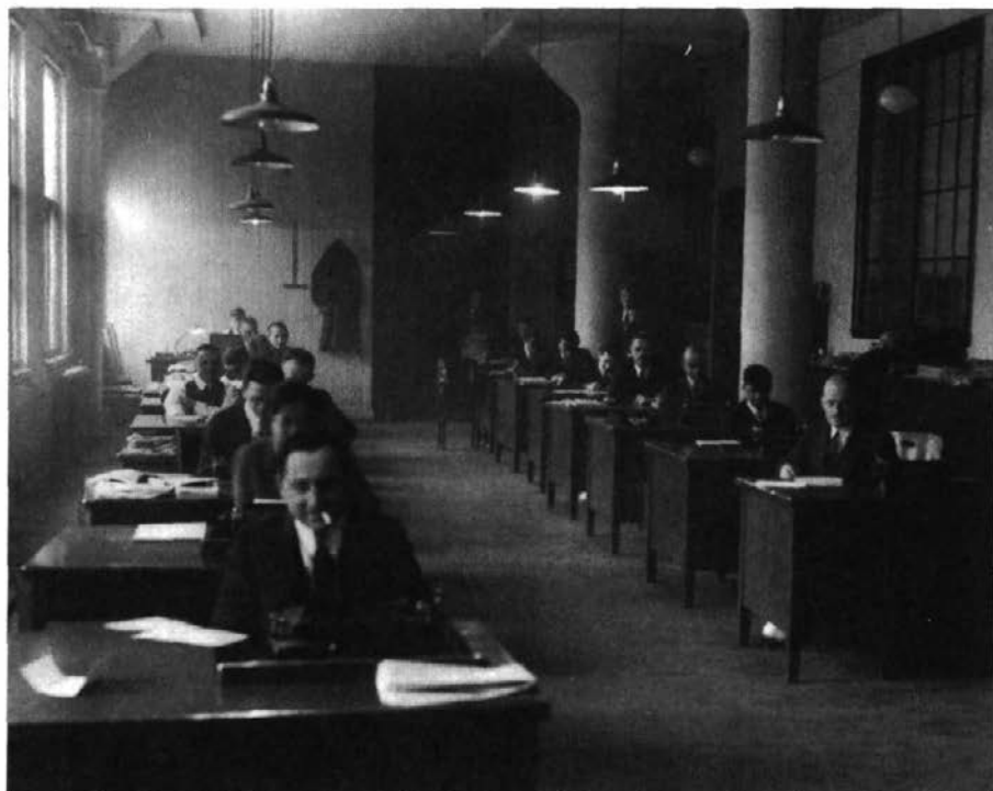
Salle de rédaction du Soleil dans les années 1930