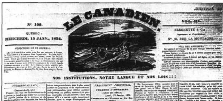
Cartouche du Canadien en 1834.

Au moment de cette quatrième renaissance, assurée par son nouveau rédacteur Étienne Parent et son imprimeur Jean-Baptiste Fréchette, Le Canadien affiche clairement sa devise: « Nos institutions, notre langue et nos lois ». De plus, Parent voudra faire de son journal un instrument d'éducation: « La presse périodique, écrit-il, est la seule bibliothèque du peuple [...] et] le savoir est une puissance et chaque nouveau lecteur ajoute à la force populaire 3 . » C'est que Parent, né à Beauport et fils d'un cultivateur, sait de quoi il parle quand il fait référence à la « bibliothèque du peuple 4 . Journal d'idées, Le Canadien consacre les deux tiers de son espace aux nouvelles locales et internationales, à des extraits de littérature française et à diverses informations sur la vie culturelle. La publicité n'occupe alors que le tiers de l'espace du journal 5 .