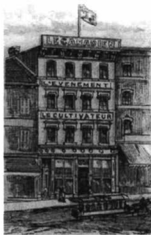
L'immeuble du Canadien, de L'Événement et du Cultivateur vers 1880.