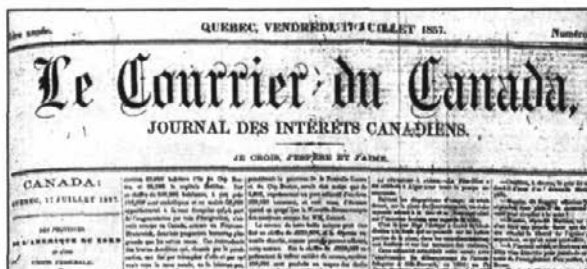
Cartouche du Courrier du Canada, 1857