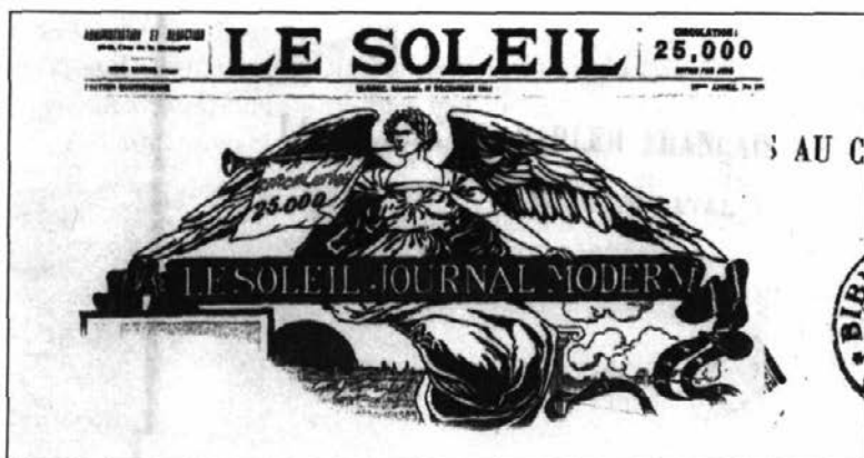
Cartouche du Soleil en 1914