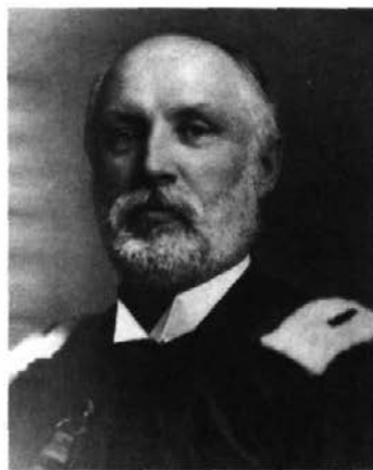
Thomas Chapais (1858-1946), journaliste, historien, homme politique et rédacteur en chef du Courrier du Canada (1884-1901)