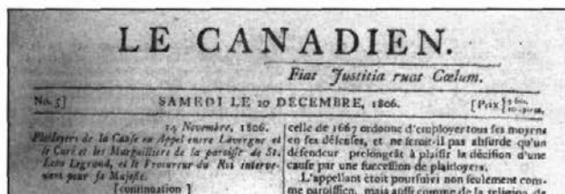
Cartouche du Canadien en 1806.