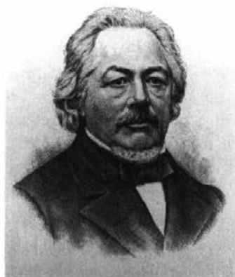
Étienne Parent (1802-1874), éditeur et rédacteur du journal Le Canadien (1825, 1831-1842)

publier à intervalles irréguliers son journal. Le Fastasque atteint une popularité qui dépasse les limites de la région de Québec pour s'étendre à tout le Bas-Canada. En 1840, il se plaint du fait que les 1 200 exemplaires du Fantasque vendus en abonnement circulent de main à main et sont lus par 7 000 ou 8 000 lecteurs; une situation qui le prive d'autant de revenus potentiels 6 !