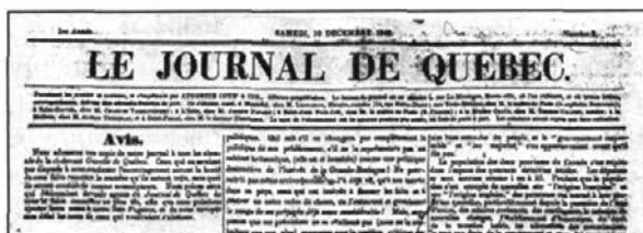
Cartouche du Journal de Québec, 1842

C'est dans ce contexte, et compte tenu du comportement peu fiable de Joseph-Édouard Cauchon et son Journal de Québec , que les évêques réunis en concile plénier en 1854 décident de fonder un nouveau journal catholique et de le localiser à Québec. Lancé en février 1857, Le Courrier du Canada comptera alors parmi ses rédacteurs des conservateurs tels Hector-L. Langevin, Joseph-Charles Taché, Alfred Garneau, Stanislas Drapeau... Ce journal de tendance ultramontaine « se préoccupe avant tout de défendre les principes catholiques, la liberté de l'Église et les grands intérêts de la nationalité canadienne... ». Ses rédacteurs considèrent qu'il importe avant tout de défendre « les principes et non les hommes 16 ». En politique, Le Courrier du Canada se situe au centre droit; malgré son indépendance déclarée, il se rapproche du parti libéral-conservateur et s'affiche comme un partisan enthousiaste de la Confédération sous la plume de Joseph-Charles Taché.