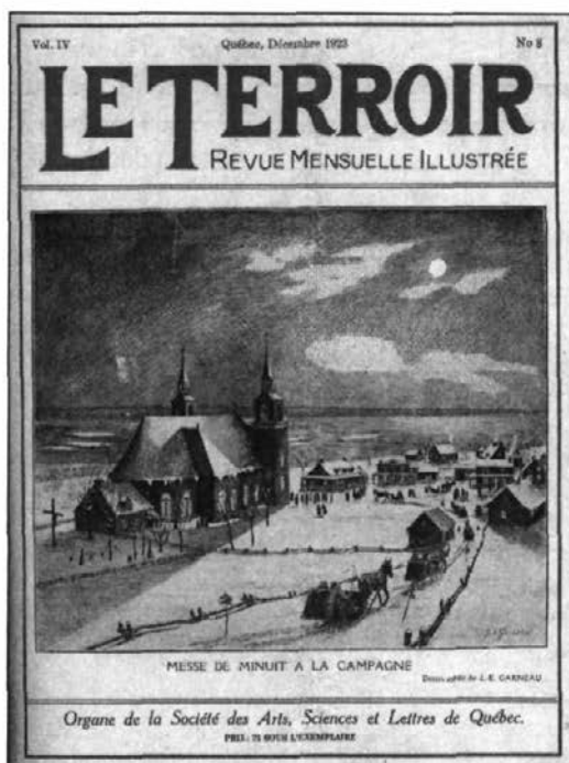
Page couverture du Terroir , décembre 1928