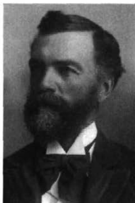
Israël Tarte (1848-1907), organisateur politique conservateur, et éditeur du Canadien, de 1874 à 1880 et de 1889 à 1893.