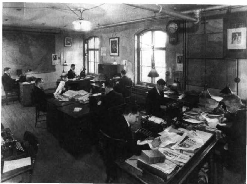
Salle des journalistes de L'Action catholique, 1934.