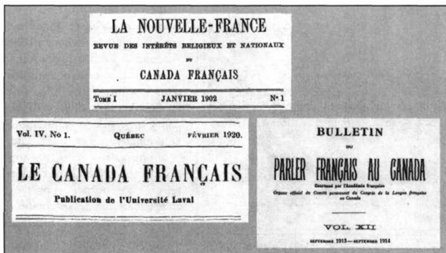
Les revues culturelles de Québec au début du XX e siècle