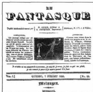
Cartouche du journal Le Fantasque , 1838

publier à intervalles irréguliers son journal. Le Fastasque atteint une popularité qui dépasse les limites de la région de Québec pour s'étendre à tout le Bas-Canada. En 1840, il se plaint du fait que les 1 200 exemplaires du Fantasque vendus en abonnement circulent de main à main et sont lus par 7 000 ou 8 000 lecteurs; une situation qui le prive d'autant de revenus potentiels 6 !