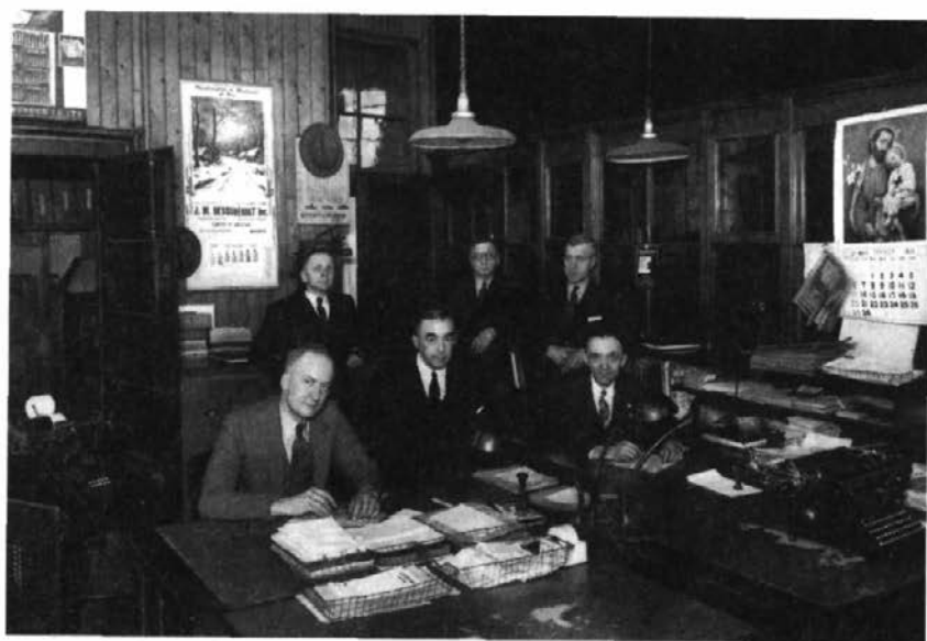
L'équipe de rédaction de L'Action catholique en 1938