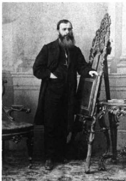
Joseph-Édouard Cauchon (1816-1885), journaliste et homme politique, fondateur du Journal de Québec en 1842.

Du côté de la communauté anglophone de Québec, trois nouveaux journaux d'une certaine importance viennent s'ajouter aux deux pionniers que sont la Quebec Gazette et le Quebec Mercury . Il s'agit du Morning Chronicle (1847-), du Quebec Vindicator (1857-1865) et du Quebec Daily News, Commercial and Shipping List (1862-1870). Parmi ceux-ci, le Morning Chronicle deviendra le seul journal à survivre aux aléas des fermetures et des fusions et continue d'être publié de nos jours sous le nom de Quebec Chronicle Telegraph .