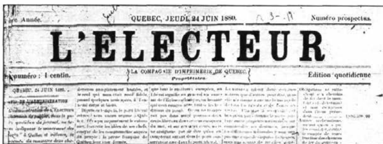
Cartouche de L'Électeur en 1880.