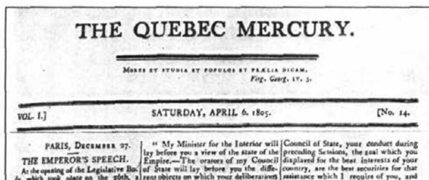
Cartouche du Quebec Mercury en 1805.

1807) accentue le clivage entre un groupe de politiciens canadiens de la Chambre d'assemblée et les marchands anglais de Québec et aboutit en 1805 à la fondation du Quebec Mercury . Son propriétaire, Thomas Cary, porte-parole de la bourgeoisie anglophone, passe à l'attaque pour dénoncer le caractère trop français du Bas-Canada et les pouvoirs exorbitants des députés du Parti canadien qui contrôlent la Chambre d'assemblée. La réaction ne se fait pas attendre: Pierre Bédard et François Blanchet fondent Le Canadien , dès 1806, pour combattre la propagande du Quebec Mercury et pour défendre les intérêts politiques des classes professionnelles canadiennes-françaises. Les deux journaux croiseront régulièrement le fer au cours des années qui suivent. Premier journal publié uniquement en français, Le Canadien permettra à une nouvelle génération de pratiquer le journalisme de combat. On y retrouve notamment Jacques Viger, premier maire de Montréal et son cousin l'essayiste Denis-Benjamin Viger, lui-même cousin de Louis-Joseph Papineau, Jean-Antoine Panet, député de la Haute-Ville de Québec, Pierre-Stanislas Bédard, chef du parti canadien et natif de Charlesbourg.