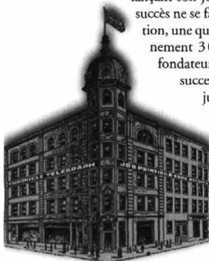
L'immeuble du Quebec Daily Telegraph, rue Buade, dans la haute-ville.