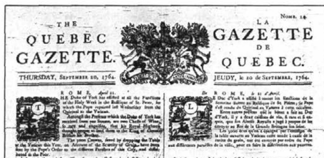
Cartouche de la Gazette de Québec en 1764.